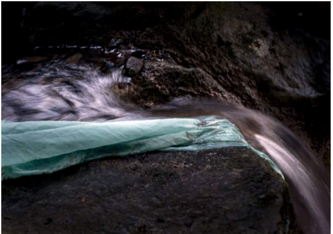
Delphine Maury, diptyque Sans titre , série Fragment , 2016 digigraphies (tirage jet d'encre pigmentaire) sur papier encadrées, 2 x 50 x 70 cm édition de 5