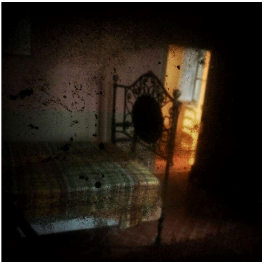
Delphine Maury, Sans titre , série Fragment , 2016 digraphie (tirage jet d'encre pigmentaire) sur papier encadrée, 50 x 50 cm, édition de 5

A l'occasion de la parution de son premier livre d'artiste, Delphine Maury présente du 9 au 11 septembre 2016, une sélection de photographies tirée de son livre. Cendrine Krempf, directrice de la galerie nomade éponyme, assure le commissariat de cette exposition éphémère.