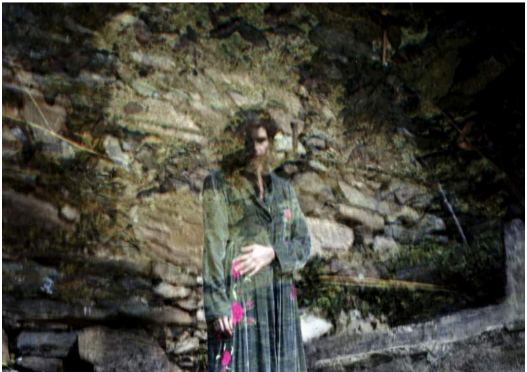
Delphine Maury, Sans titre , série Fragment , 2016 digigraphie (tirage jet d'encre pigmentaire) sur papier encadrée, 50 x 70 cm, édition de 5