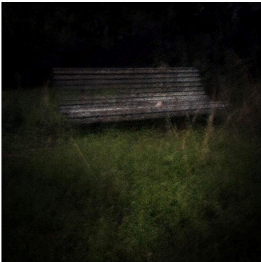
Delphine Maury, Sans titre , série Fragment , 2016 digigraphie (tirage jet d'encre pigmentaire) sur papier encadrée, 50 x 50 cm, édition de 5